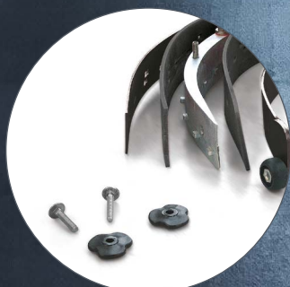
VISPA 35 E-B-BS Pentru a obține o uscare bună este necesar să mențineți mereu curate lamelele racletei. Înlocuirea lor în caz de uzură este foarte simplă.