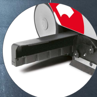
VISPA 35 BS Sertarul de colectare este foarte simplu de extras pentru a goli micile deșeuri colectate. Sertar de colectare ușor de curățat.