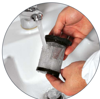
VISPA 35 E-B-BS Curățarea totală a filtrului de aspirație simplă și practică.

Rapiditatea cu care se pot efectua operațiunile de curățare la sfârșitul zilei permite menținerea Vispa mereu eficientă în timp.