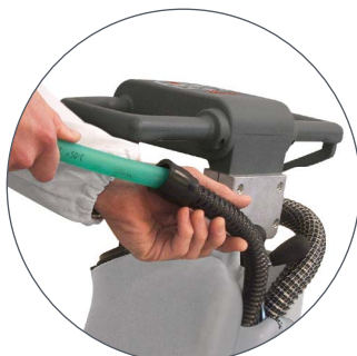
VISPA 35 B-BS Curățarea periodică a furtunului racletei pentru a garanta o aspirație eficientă.