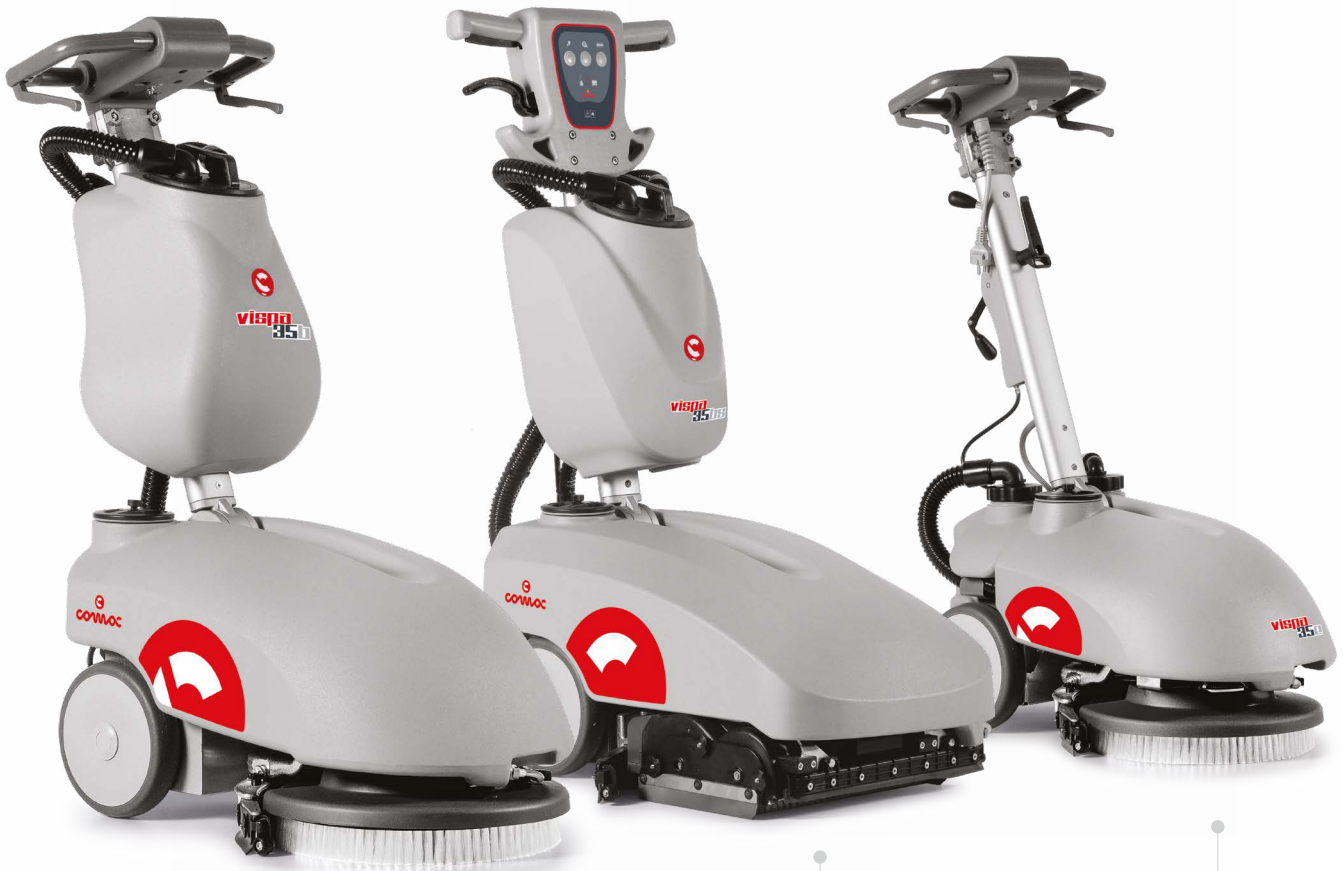
VISPA 35 B Versiune de spălare cu baterie cu perie disc Lățime de lucru: 350 mm