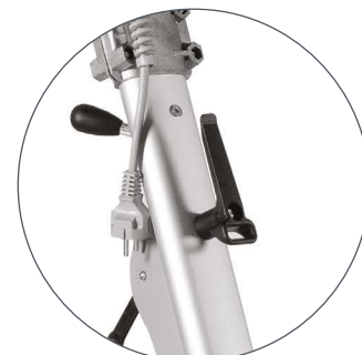
VISPA 35 E Cârligul practic poate fi utilizat ca dispozitiv de fixare a cablului, când mașina lucrează, sau ca suport pentru cablu (prelungitor de 15 m disponibil ca opțional la cerere).